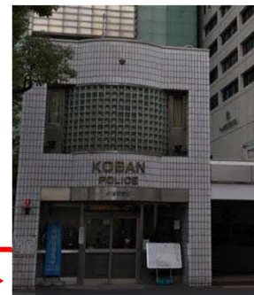
<集合場所写真・周辺地図>